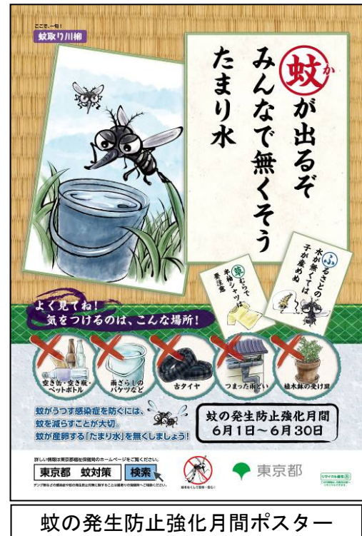
蚊の発生防止強化月間ポスター