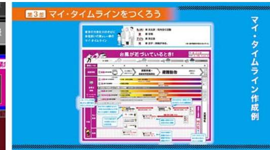
【第3部マイ・タイムラインをつくろうのイメージ】