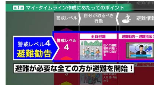
【第1部マイ・タイムライン作成のポイントのイメージ】