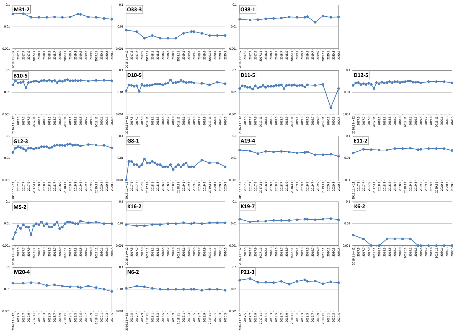
※グラフの縦軸は濃度(mg/L)を表している ※不検出(0.001mg/L未満)は0.001mg/Lとしてプロットしている