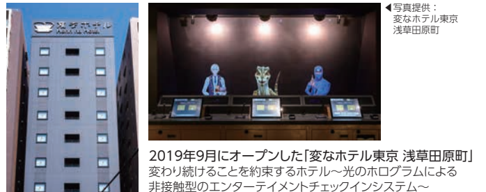
2019年9月にオープンした「変なホテル東京 浅草田原町」 変わり続けることを約束するホテル~光のホログラムによる 非接触型のエンターテインメントチェックインシステム~

※各プログラムは予告なく変更となる場合があります。 あらかじめご理解いただきますようお願いいたします。