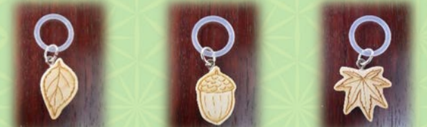
(9月のプレゼント) ヤマザクラの葉

動画をご覧になった後、感想をお送りいただいた方の中から、抽選で 毎月100名様に 水道水源林の間伐材(ヒノキ)で作成した 傘マーカー をプレゼントします! プレゼントは毎月変わります♪ 毎月1日に公開される動画を見て、ぜひ毎月ご応募ください。