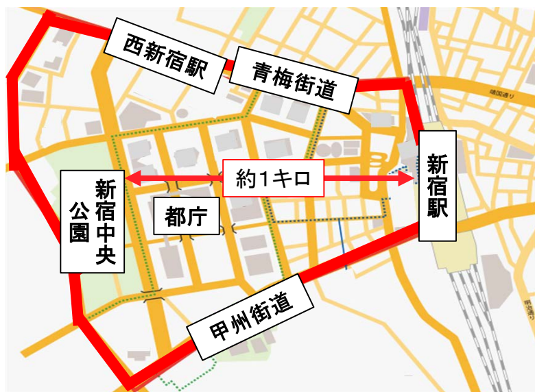
【西新宿エリア(赤枠内)】