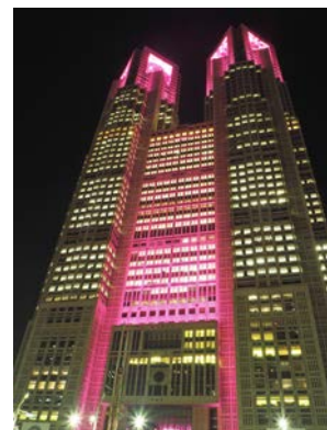
↑ ↓ 都庁舎のライトアップ

点灯期間：10月1日（木曜日）から10月21日（水曜日）まで 午後6時から午後11時まで