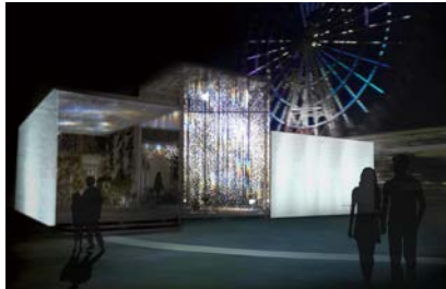
ARTBAY HOUSE を煌びやかにライトアップします