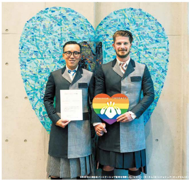
LGBTQが直面する社会課題を知ろう。 渋谷区パートナーシップ証明取得への思い。