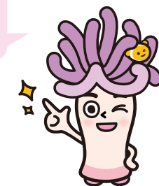
イソギン・チェック相談員