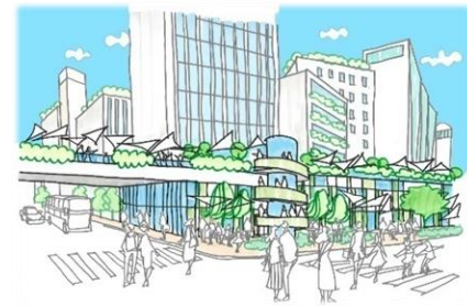
見る・見られる都市の魅力が生まれます。