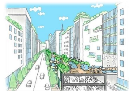
地上や周辺施設と重層したネットワークが創り出されます。