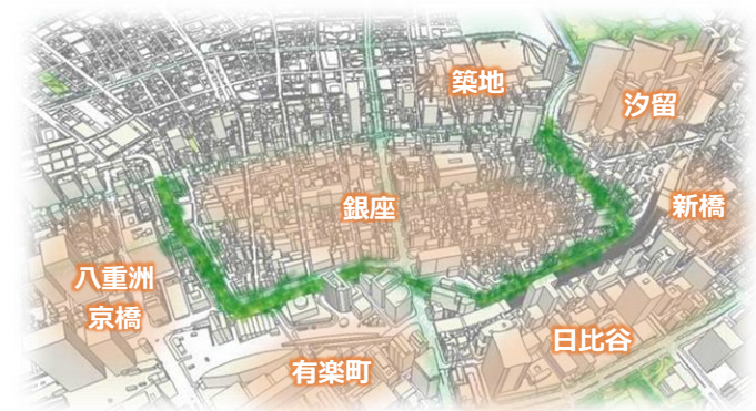
東京高速道路の位置図