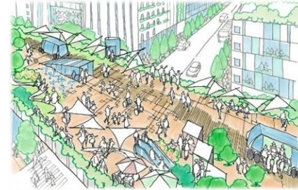
まちを眺めて楽しめる新しい都市の視点場となります。