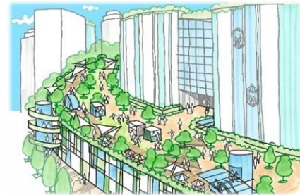
地区間をつなぐ歩行者ネットワークが創出されます。