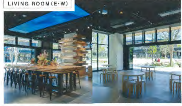
LIVING ROOM (E-W)

人々の交流を生む、ユーティリティ空間 ラウンジ・インフォメーション・イベント会場の3つの機能を持ちあわせており、様々な場面で活用されます。