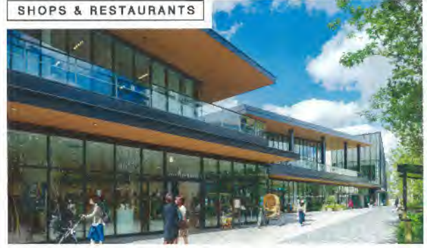
SHOPS & RESTAURANTS

地域・施設・人のつながりを生み出す「まちの縁側」 緑と水があふれる広場を中心にした、開放的なショッピング空間。まち歩き楽しさと、心地よい体験をお届けします。