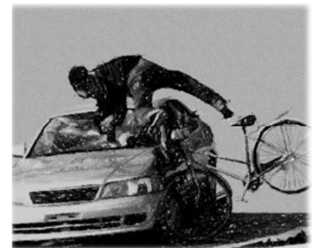
自転車事故イメージ (警視庁交通安全情報)