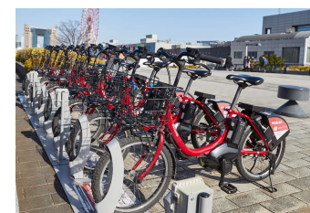
自転車シェアリング