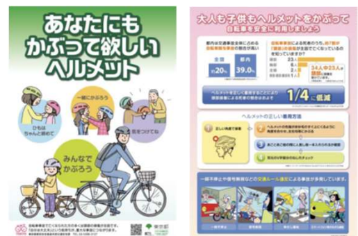
ヘルメット着用啓発リーフレット