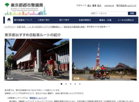
自転車マップホームページ