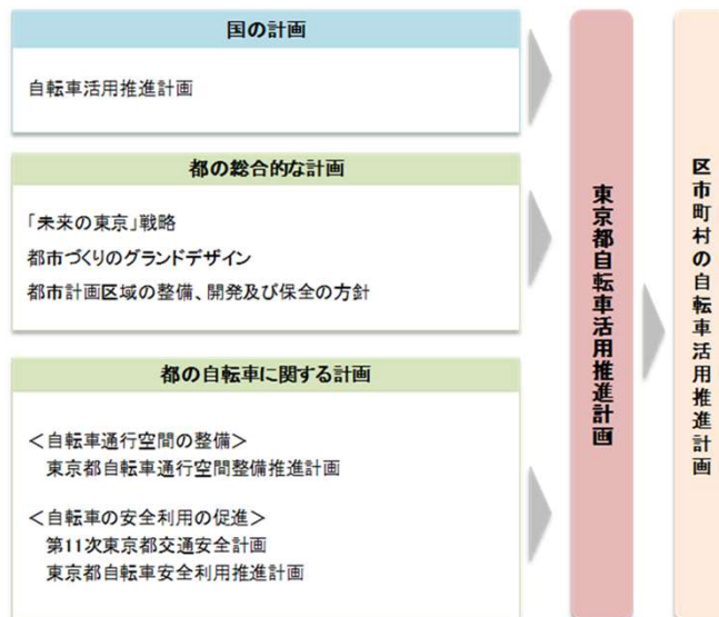
東京都自転車活用推進計画の位置付け