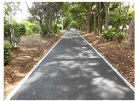
海上公園内サイクリングルートの整備