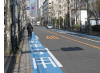
普通自転車専用通行帯（自転車レーン）