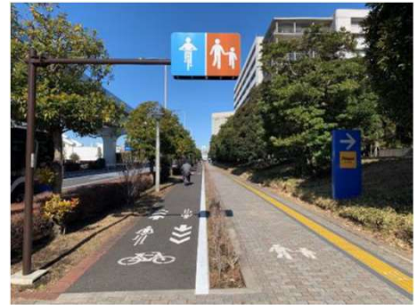
自転車通行空間等の整備推進