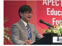
シンポジウムの座長