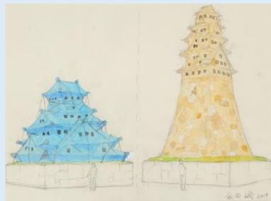
東京城 作：会田誠（本プロジェクト案） 撮影：宮島経 © AIDA Makoto Courtesy of Mizuma Art Gallery