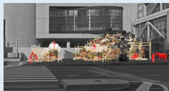
ストリート ガーデン シアター 設計：藤原徹平 (本プロジェクト案)