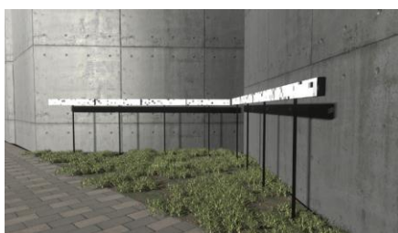
“2020-2021” 作：真鍋大度 + Rhizomatiks (本プロジェクト案)