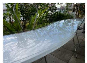
水明 設計：妹島和世（本プロジェクト案）