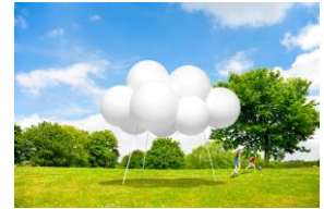
Cloud pavilion (雲のパビリオン) 設計：藤本壮介 (本プロジェクト案)