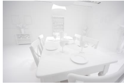
オブイタレーションルーム 作：草間彌生（本プロジェクト案） ©YAYOI KUSAMA Yayoi Kusama / The obituration room 2002-present Collaboration between Yayoi Kusama and Queensland Art Gallery, Commissioned Queensland Art Gallery, Gift of the artist through the Queensland Art Gallery Foundation 2012 Collector: Queensland Art Gallery, Australia Photograph: QAGOMA Photography 協力：オオタフインアーツ