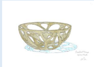
Global Bowl 設計：平田晃久 (本プロジェクト案)