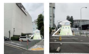
茶室「五庵」 設計：藤森照信 (本プロジェクト案)