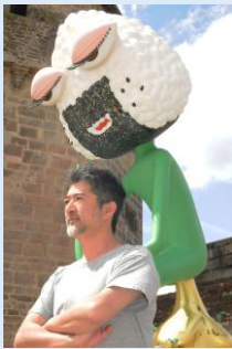
© AIDA Makoto Courtesy of Mizuma Art Gallery

作：会田誠 会場：明治神宮外苑 いちょう並木入口(東京都港区北青山2丁目1番地先)