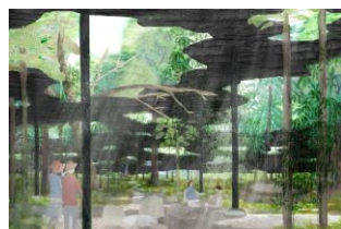
木陰雲 設計：石上純也（本プロジェクト案）