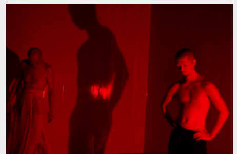
「RED & GREEN」