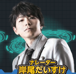
ナレーター 岸尾だいすけ

詳しくは特設WEBサイトをチェック! ▶ https://joqr.co.jp/cmaward/