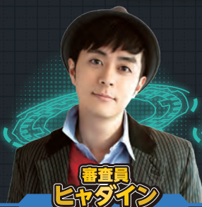
審査員 ヒヤダイン