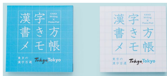
▲漢字書き方メモ帳