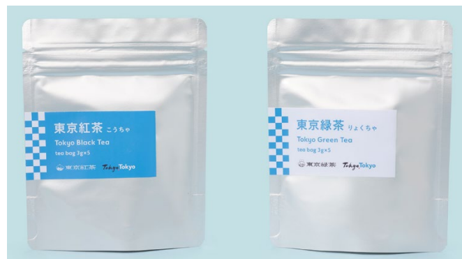
▲東京緑茶・東京紅茶

お問い合わせフォーム : https://thebase.in/inquiry/tokyotea-official-ec