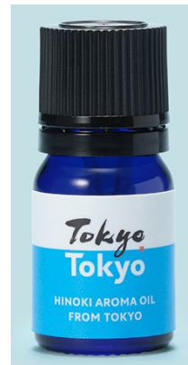
▲東京産ひのきアロマ精油 5 ml

お問い合わせフォーム : https://www.smd-wood.com/m/ (ページ右上)