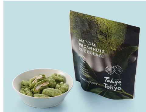
▲ 抹茶ペカンナッツショコラ