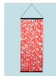
▲歌舞伎衣裳・三千歳(梅)