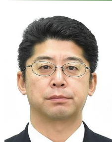
中村 康治 日本銀行 国際局兼企画局 審議役、気候連携ハブ長