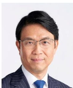
水野 弘道 国連事務総長特使