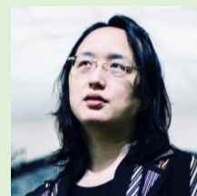
台湾デジタル担当大臣 オードリー・タン氏