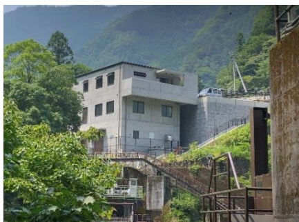
エコっと白丸 外観（3階）

※換気の強化、清掃消毒等の徹底、混雑時の入場制限の実施など、新型コロナウイルス感染拡大防止対策を行ったうえで開館いたします。ご来館の際は、マスクの着用・咳エチケット、手指消毒・検温にご協力ください。