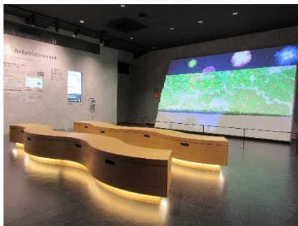
プロジェクションマッピング