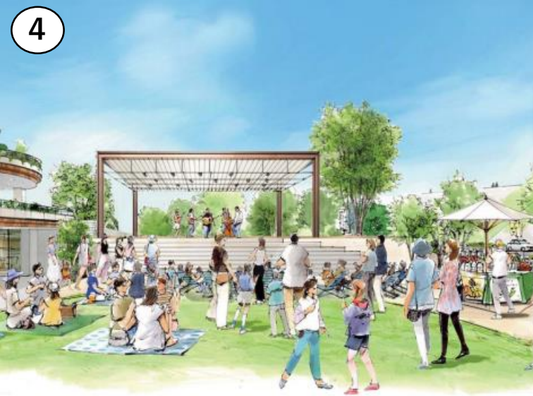
にぎわい広場と発信テラス