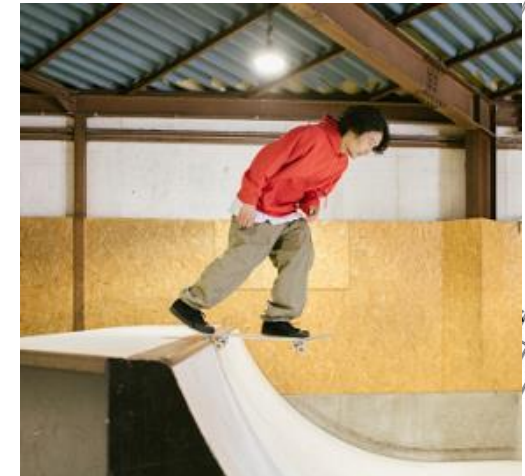
屋内外でスケートボードを楽しめる アーバンスポーツパーク