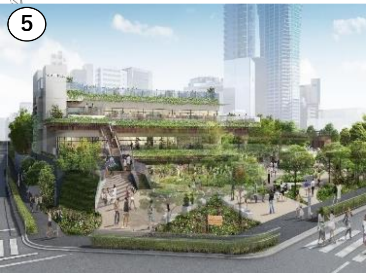
原宿側からのメインエントランス