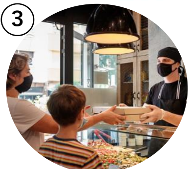
屋内外で飲食可能なフードホール