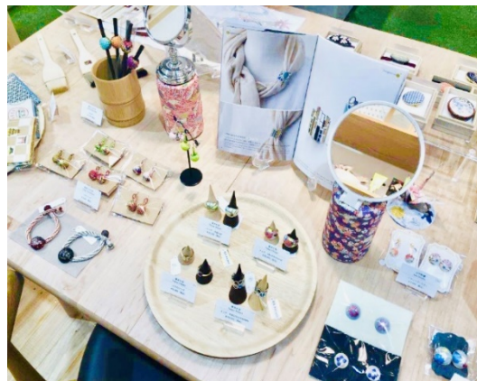
販売「伝統工芸品ショップ」イメージ