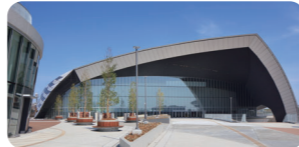
武蔵野の森総合スポーツプラザ