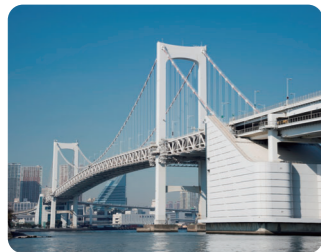
レインボーブリッジ

有明アリーナや、東京辰巳国際水泳場などの国際スポーツイベントが開催された施設周辺をまわり、そのレガシーに触れてみましょう!