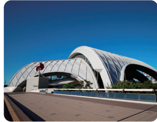
東京辰巳国際水泳場