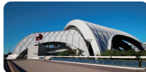
東京辰巳国際水泳場