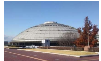
運動施設イメージ

※運動施設は暑さ対策、バリアフリー化対応など誰もがスポーツに親しめる環境を整備（屋外→屋内）