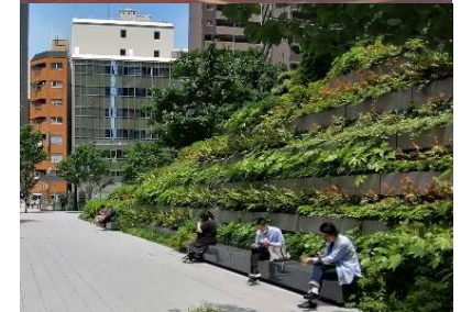
壁面緑化イメージ