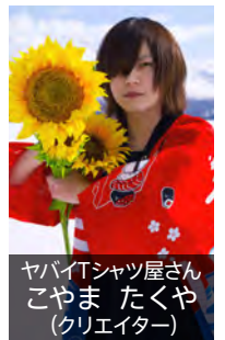
ヤバイシャツ屋さん こやま たくや (クリエイター)