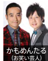
かもめんたる (お笑い芸人)