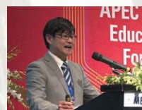
シンポジウムの座長