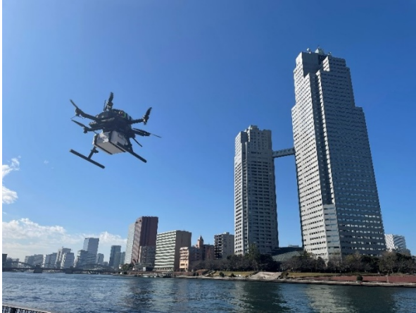
プロジェクトのイメージ (令和3年度のプロジェクトでの飛行の様子)

【プロジェクト実施者】 KDDI株式会社、KDDIスマートドローン株式会社、日本航空株式会社、東日本旅客鉄道株式会社、株式会社ウェザーニューズ、株式会社メディセオ