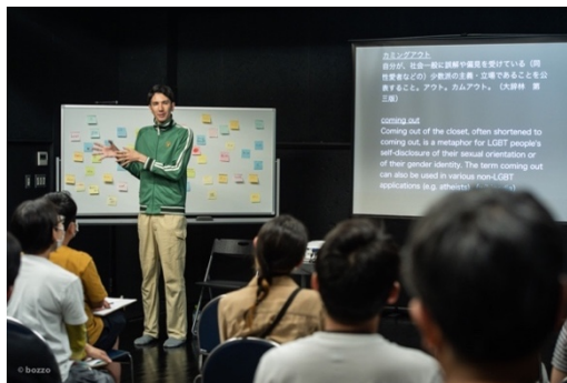
2021年度 城崎国際アートセンター アーティスト・イン・レジデンス プログラム y/n『カミングアウトレッスン』試演会 城崎国際アートセンター (2021)

日程：10月7日(金)～9日(日) 会場：東京芸術劇場 アトリエイースト・アトリエウエスト (予定)