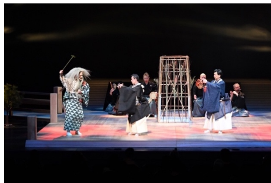
昨年の公演より