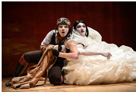
『The Scarlet Princess』(2018年)