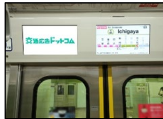
高齢運転者への啓発動画 配信イメージ

・各種街頭活動を通じて交通ルールの周知やマナー向上を呼びかけ等【新規】…P. 59