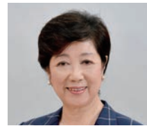
小池 百合子 東京都知事