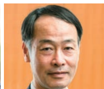
中島 淳一 金融庁 長官