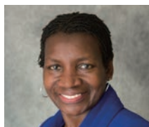
アンドレア・ドール 世界銀行 財務局資金調達責任者