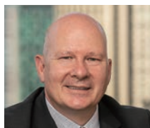
デイビッド・アトキン PRI(責任投資原則) 最高経営責任者