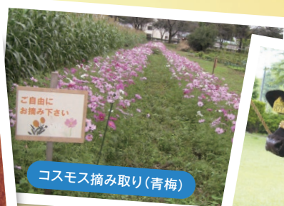
コスモス摘み取り(青梅)