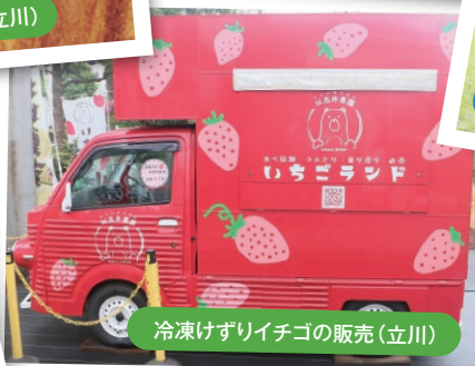
冷凍げずりイチゴの販売(立川)