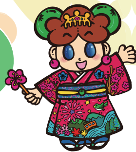
青梅市公式キャラクター ゆめめちゃん