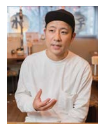
株式会社アールキューブ 肉汁水餃子 餃包 曾 茂氏