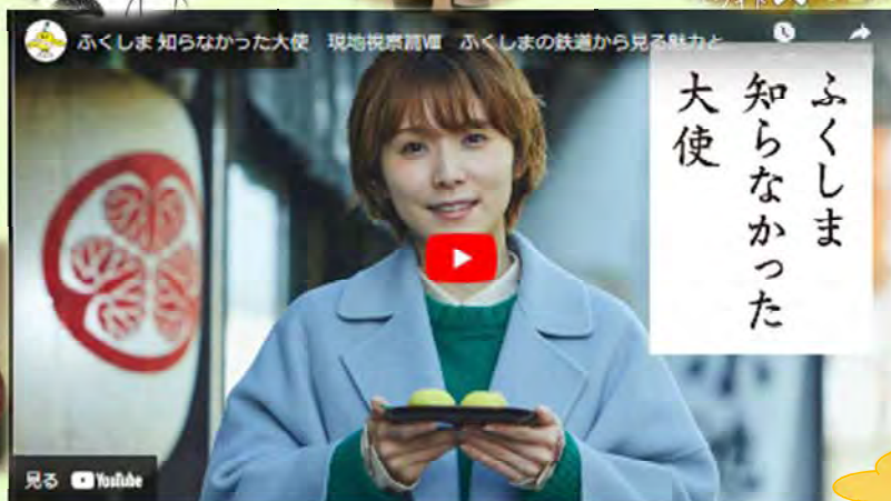
現地視察篇Ⅷ ふくしまの鉄道から見る魅力と伝統