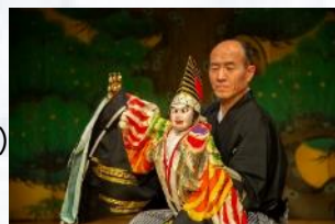
八王子車人形（八王子）