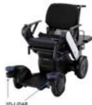
使用車両イメージ