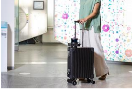
使用機器イメージ