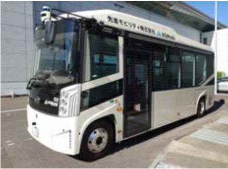
使用車両イメージ