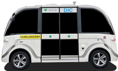
使用車両イメージ