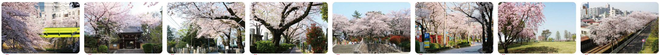
1 面影橋 2 法明寺 3 雑司ヶ谷霊園 4 染井霊園 5 飛鳥山公園 6 あらかわ遊園前 7 尾久の原公園 8 三河島水再生センター前