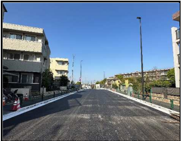
複交差点付近より都立祖師谷公園方面を望む