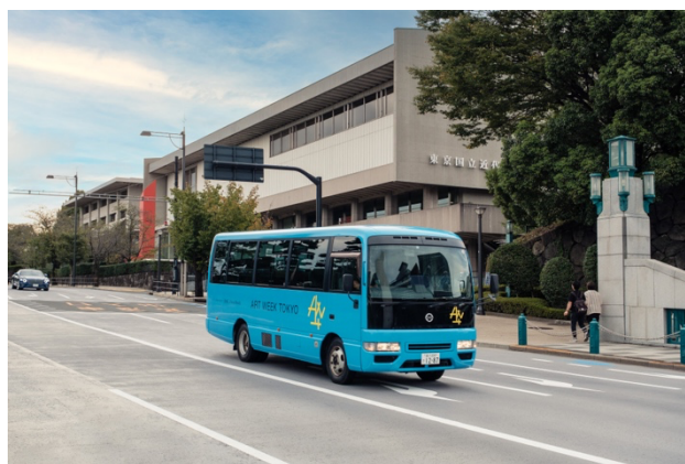
2022 年度 AWT 会期中に 6 つのルートで 50 以上のアートスペースをつないだシャトルバス《AWT BUS》