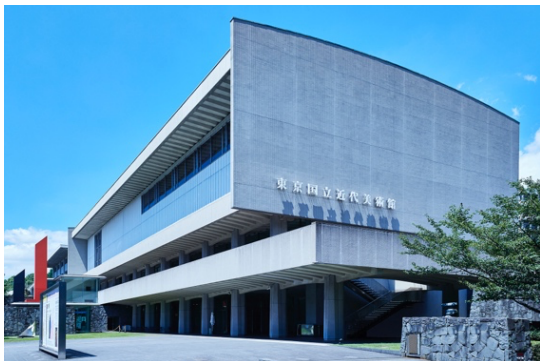
東京国立近代美術館外観

資生堂ギャラリー（銀座）のような企業が運営するインスティテューションなど、多彩なラインアップが揃っています。