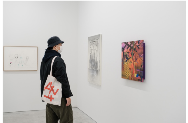
「Group show “for TZ”」展示風景 2022 年 ナンツカアンダーグラウンド