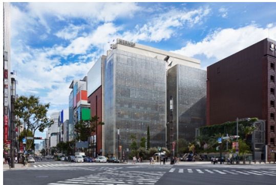
銀座メゾンエルメス外観

今年参加する東京のアートシーンの多様性を反映した 39 ギャラリーは、日本の現代アートの草分けとしてその歴史を紡いできた 東京画廊+BTAP （銀座）をはじめ、 ギャラリー小柳 （銀座）、 タカ・イシイギャラリー （六本木）、 オオタファインアーツ （六本木）、 スカイザバスハウス （根津）が昨年に引き続き参加するほか、今年には 小山登美夫ギャラリー （六本木）、 シュウゴアーツ （六本木）の2つの老舗ギャラリーも加わります。