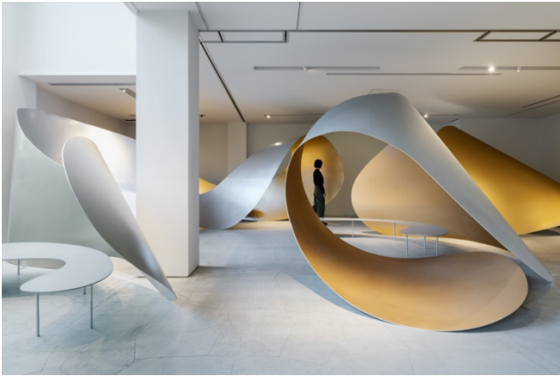
建築家・萬代基介が設計を手がけた 2022 年度の《AWT BAR》