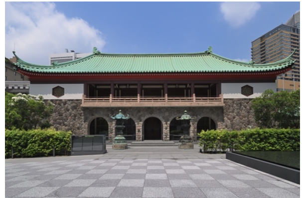
《AWT FOCUS》会場・大倉集古館