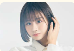
金子 みゆ (アイドル/タレント)