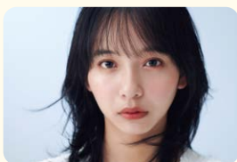
山之内 ずず (タレント・女優)