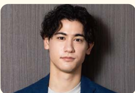
国山 ハセーン (プロデューサー/タレント)