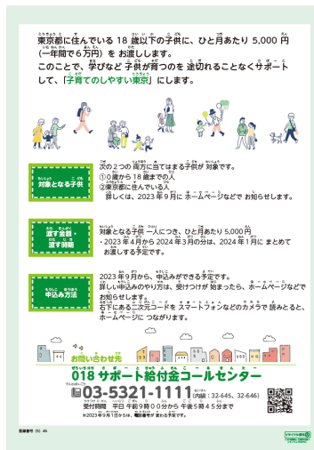
(やさしい日本語版・裏)