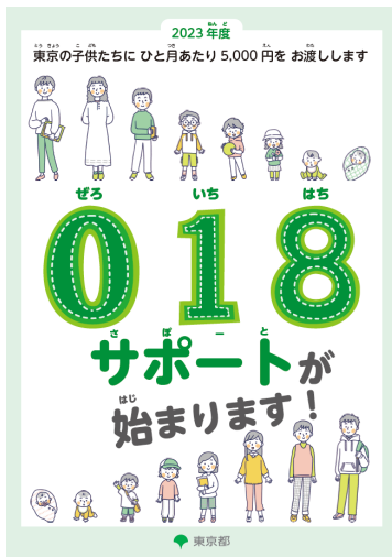
(やさしい日本語版・表)