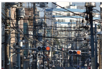
令和4年度 高校生以下の部 都知事賞「都内の住宅街」