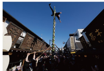
令和4年度 一般の部 都知事賞「流石の参道前」