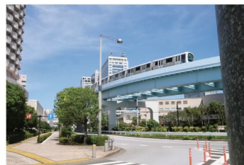
令和4年度 高校生以下の部 都知事賞「街灯からこっそり」