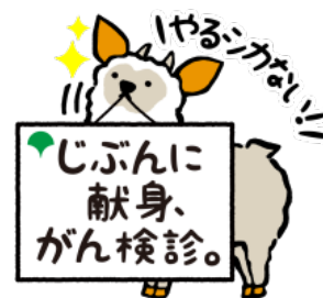
東京都がん検診啓発キャラクター 「モシカモ」くん