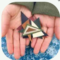
素材などを使って ワーク ショップ!

このプログラムでは、次世代を担うみなさんが、東京の様々な自然を知り、いま大きな課題となっている生物多様性の保全について学ぶことができます。私たちの暮らしに欠かせない水や食料、木材など色々な恵みを与えてくれる豊かな自然にふれ、自然と人のつながりについて一緒に考えてみませんか？この機会にぜひ自然と仲良くなってみましょう。