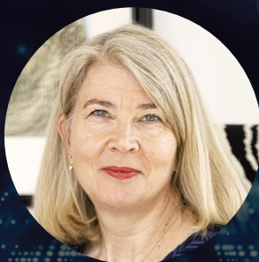
タンヤ・ヤスケライネン 閣下 駐日フィンランド共和国特命全権大使