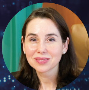
マリエタ・アラバジエヴァ 閣下 駐日ブルガリア共和国特命全権大使