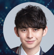
ハリー杉山 氏 タレント (モデレーター)