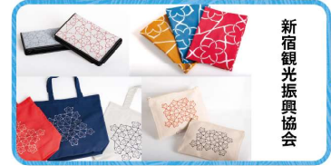
新宿観光振興協会