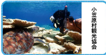
小立原村観光協会