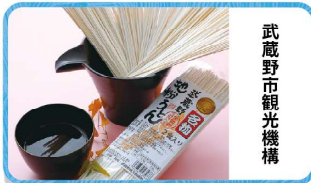
武蔵野市観光機構