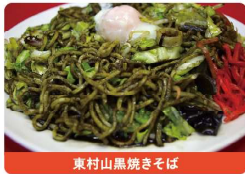
東村山黒焼きそば