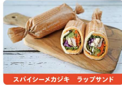
スパイシーメカジキ ラップサンド