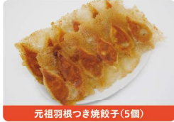
元祖羽根つき焼餃子(5個)