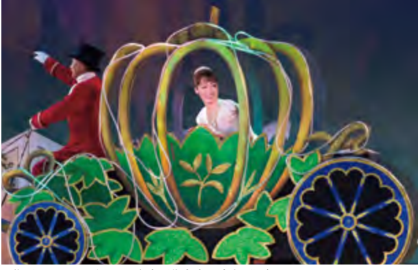
原作/シャルル・ペロー 脚本/北麦生 演出/源紀 音楽/塩谷翔 振付/相羽源氏

美しい音楽と本格的なバレエで綴る幸せの物語 優しく真面目で、いつも微笑みを忘れない心の美しいシンデレラは、灰かぶりと言われて継母や姉達にいじめられていました。しかし魔法使いによってお城の舞踏会で王子様と出会い、やがて幸せになる物語。