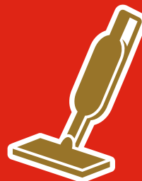
ハンディクリーナー