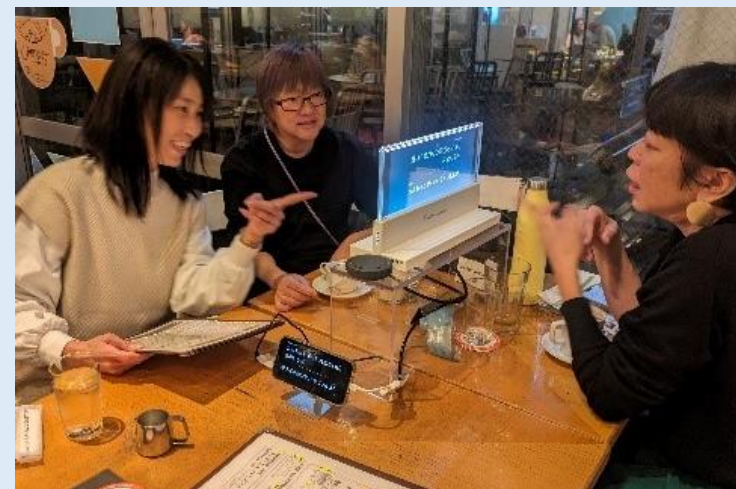
デジタル技術を活用したコミュニケーションを体験できるカフェ (2023年11月15日～11月26日)