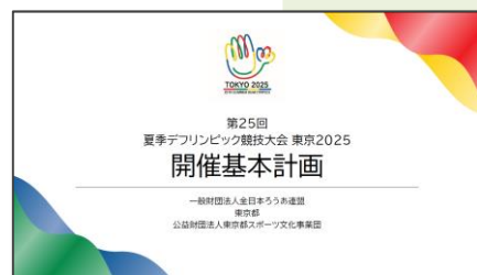
大会開催基本計画