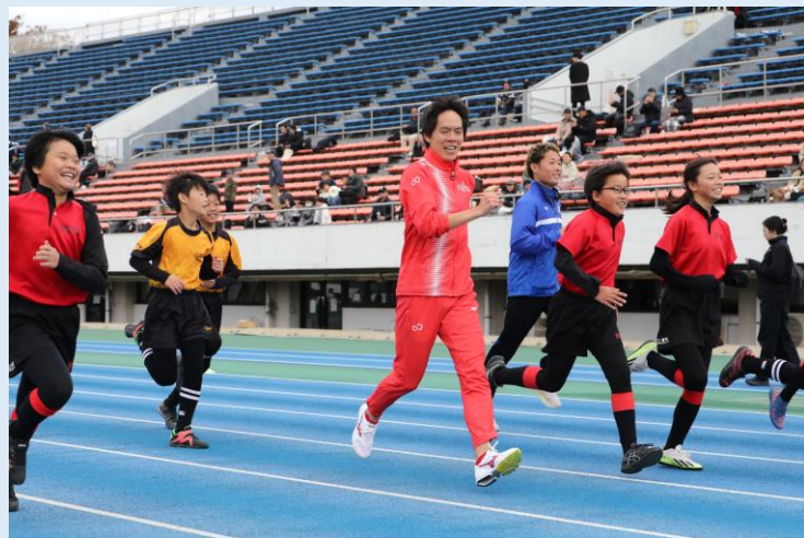
走り方教室 (2023年11月25日)

大会を成功に導くとともに、大会の場を活用して様々な取組を展開することは、 東京の新たな活力 となる